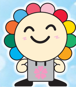
さいたま市選挙キャラクター みらいくん