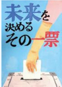
(学年・氏名非公開) 宮原中学校(北区)